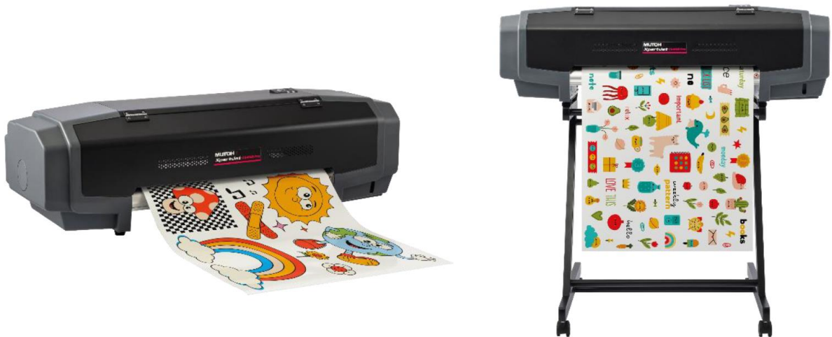
XpertJet C641SR Pro – 630mm (24") wide printer/cutter

Συμπαγές, μικρό, ευέλικτο, οικονομικό, 63cm, συνδυάζει τη μοναδική τεχνολογία εκτύπωσης των Mutoh XpertJet SR Pro, με ενσωματωμένη λειτουργία περιγραμμικής κοπής !